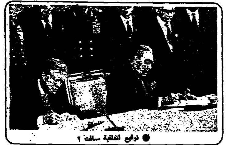
دفع اتفاقية سالت 2

عن : التمايز التكتيكية ويضيف الاجابة على هذا السؤال قبل «التزال» سالت عن «الرهبة» الموضوعية نوقه في الفترة الحالية .